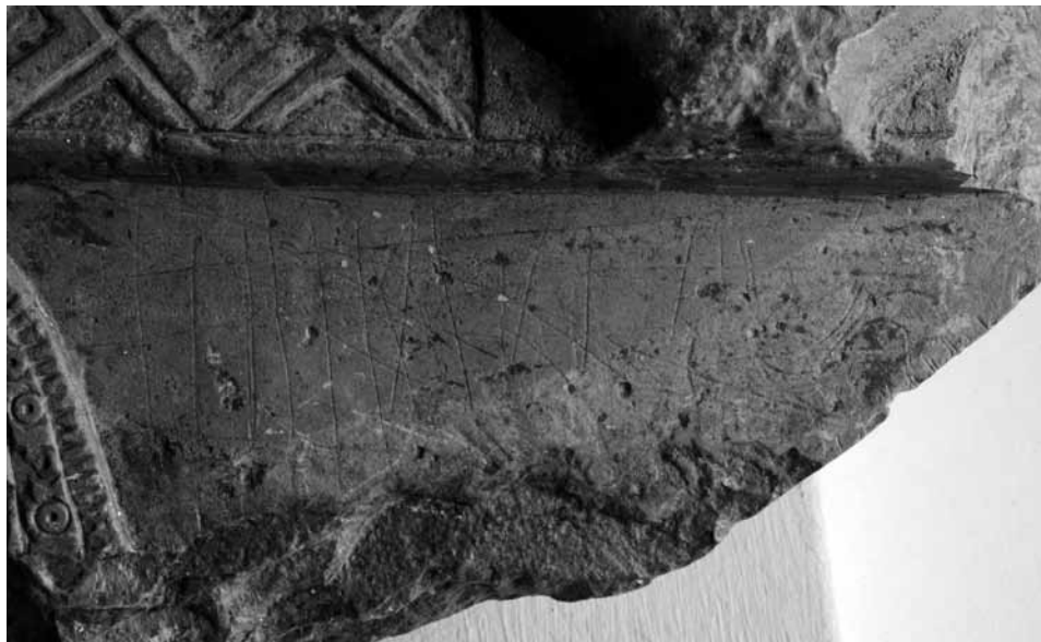
Fig. 6 - Particolare delle incisioni filiformi del secondo registro. A sinistra l'uccello acquatico.

braccia evolute in ornitomorfi, a rimandare alla simbologia della barca solare (Fossati 1994: 211). Su una parte della statua si è dunque appollaiato un piccolo uccello, dall'aspetto decisamente naturalistico, che sembra pertanto delineare una "scena di genere". Nell'arte delle situle una composizione simile si ritrova sulla situla della Certosa, dove un grosso volatile è posato sul dorso di un cinghiale che viene trascinato da un servo verso il luogo del banchetto (Zannoni 1876, tav. XXXV).