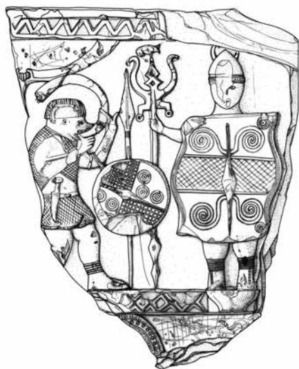
Figg. 1 e 2 - Il rilievo di Bormio (disegno: F. Roncoroni).

parallele, quella inferiore, invece, è composta da una serie di losanghe comprese sopra e sotto da elementi angolari e da due bande parallele. Al di sotto si riconosce una piccola porzione, in visione laterale, forse della criniera di un cavallo 3 o del lophos di un elmo (Rittatore 1974: 113 e fig. 5; de Marinis 1995: 259). Si tratterebbe dunque del lacerto di una scena di soggetto militare, una parata di armati a piedi o a cavallo.