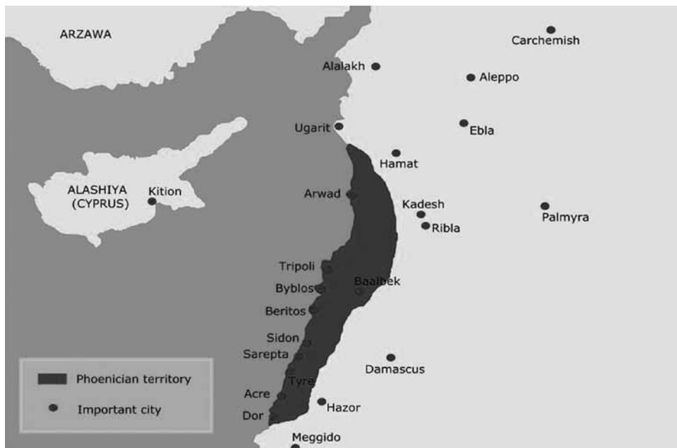
Fig. 2 - Il territorio fenicio.

Un altro caso esemplare di autopsia erodotea è la descrizione del tempio di Karnak (Figura 3) al passo III 143: questa testimonianza viene spesso citata per una celebre disputa che l'autore intraprende con Ecateo di Mileto, il più antico storico greco a noi noto, in tema di antichità delle genealogie aristocratiche greche. Per sostenere l'inesattezza delle idee di Ecateo (convinto che bastino 15 generazioni per arrivare ad avere una divinità come antenato) Erodoto enumera le 345 statue di sommi sacerdoti che gli vengono mostrate nei sotterranei del tempio: esse rappresentano altrettante generazioni, secondo quanto rivelano gli stessi sacerdoti che accolgono il visitatore, e rivelano così la grande profondità cronologica che gli Egizi attribuiscono al loro passato.