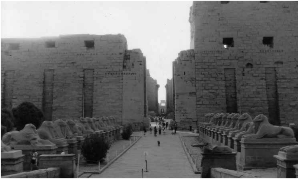
Fig. 3 - Ingresso del tempio di Karnak (Egitto) (fonte: https://upload.wikimedia.org/wikipedia/it/e/e6/Tempio_di_Karnak_ingresso.jpg ).

spesso i santuari sono anche preziosa memoria della civiltà cui appartengono e testimonianza del grado di antichità di un popolo. Ne sono prova tangibile soprattutto i passi che ho menzionato riguardanti il tempio dell'Eracle fenicio e il santuario di Karnak. Lo storico si serve della testimonianza sacerdotale per ricostruire capitoli dimenticati o confusi della storia dell'umanità, andando ben oltre a quelle che sono le testimonianze greche e suggerendo, in modo implicito, che la storia religiosa di un popolo possa essere utilizzata in modo generico, se non addirittura universale, per ricostruire una sorta di linea del tempo delle genealogie umane. La testimonianza fenicio-cipriota infatti è fatta dialogare con la memoria egizia, ottenendo come risultato il grado di antichità di una divinità che per i Greci rientrava tra le più 'giovani'. Eracle è ritenuto uno dei primi otto dei per gli Egizi 11 , ma secondo una cronologia mitica e divina molto più risalente e remota, in termini di secoli, rispetto a quella greca 12 . Ancora una volta la visita a un santuario, come qui a Karnak, è svolta in funzione della smentita di un'erronea affermazione da parte dei Greci, qui nella fattispecie da parte di un altro storico, Ecateo, che a sua volta sbaglia di secoli il conteggio delle generazioni umane rispetto a quanto si deve desumere da un analogo e più corretto conteggio fatto dagli Egizi.