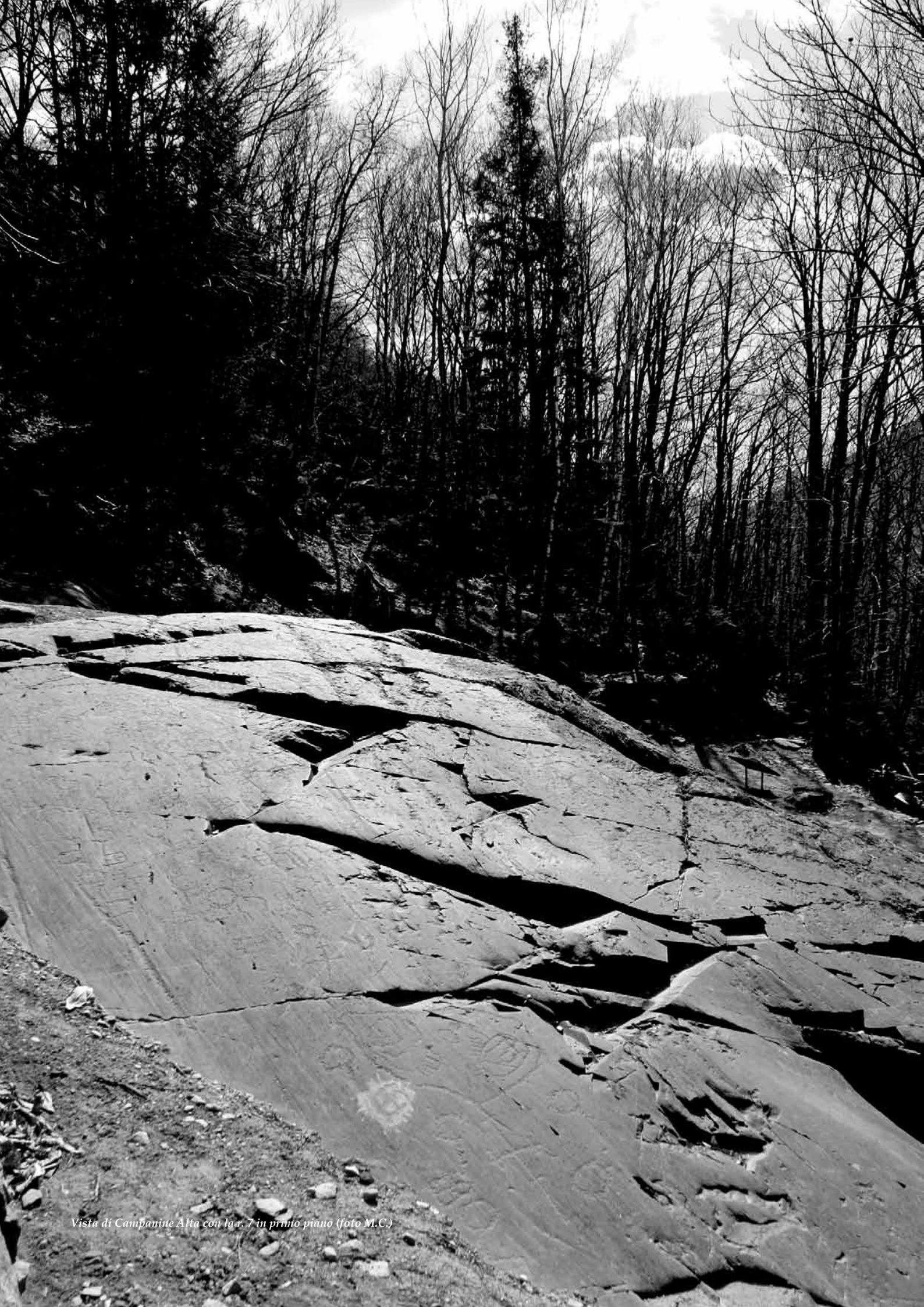
Vista di Campanine Alta con la r. 7 in primo piano