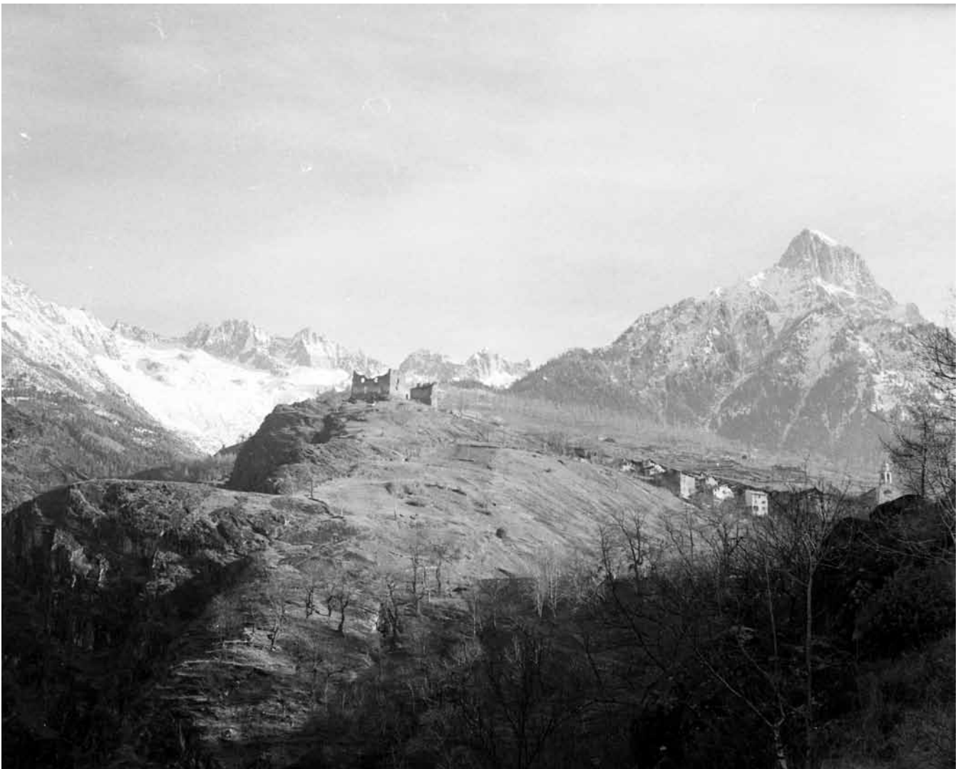
Vista sul castello di Cimbergo in una foto storica dell'Archivio della Missione Anati, 1957 (foto E.A.)