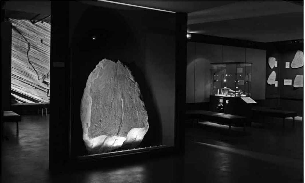
Stèle dite du « Chef de Tribu ».