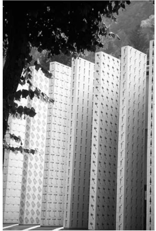
Colonnes du parvis du musée.