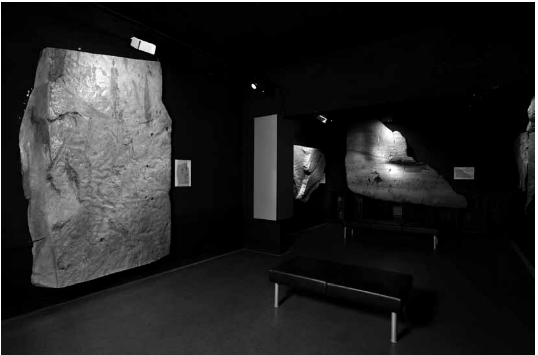
Moulages de roches gravées.