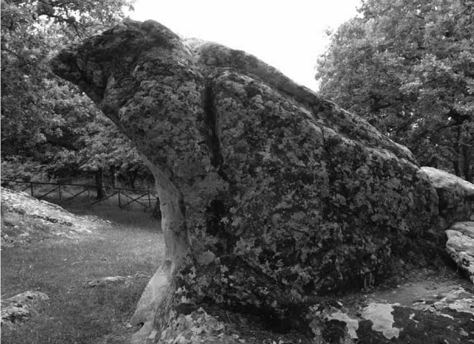
Fig. 6 - Il monolite B o Aquila di Ficuzza

ovale irregolare, s'immerge anch'esso a 45 gradi 24 . Lungo m. 7,50 circa, largo m. 3,00, altezza non superiore a m. 3, presenta una piccola piattaforma bordante il lato di Nord-Est con due cavità quadrangolari, a servizio degli scoli provenienti dalle coppelle del top ;