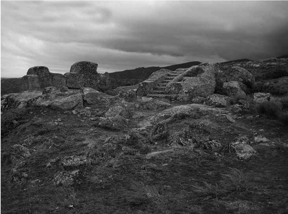
Fig. 12 - Santuario rupestre protostorico di Castro-de-Ulaca (Avila)

i caratteri mescolano il valore alfabetico con quello sillabico. È stato accertato che la scrittura iberica è derivata da quella fenicia, attraverso l'antico alfabeto greco, utilizzato prima della unificazione alfabetica ionica 45 .