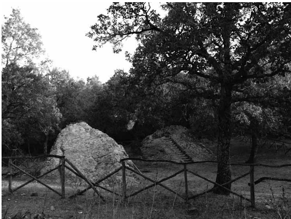
Fig. 2 - Il Santuario rupestre protostorico di Ficuzza o Pulpito del Re di Ficuzza

(m. 927 s.l.m.), il Cozzo Fanuso (m. 1069 s.l.m.) e il Cozzo Pulpito del Re (m. 864 s.l.m.), noto soprattutto per il “sedile” realizzato nella roccia arenaria, che il racconto popolare attribuisce al Re Ferdinando IV di Borbone (l’opera sarebbe servita da palco per l’apostamento durante la caccia 13 ).