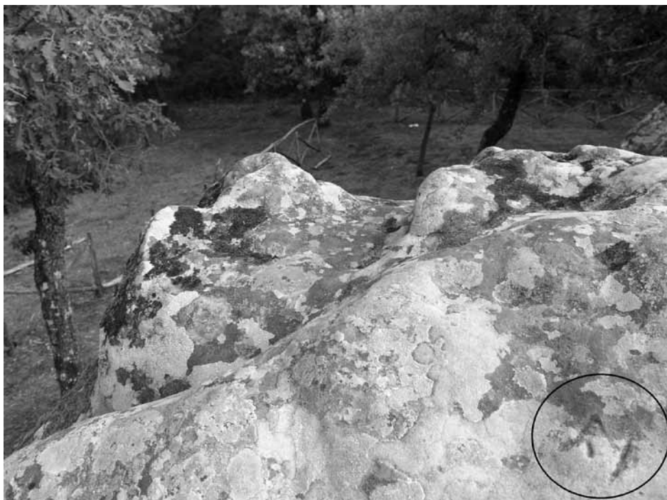
Fig. 7 - Segni alfabetici anellenici al vertice del monolite B