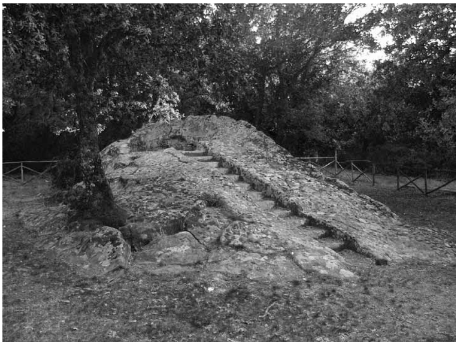
Fig. 11 - Santuario rupestre protostorico di Ficuzza

grafica, poiché potrebbe risultare che il segno faccia parte del messaggio, come: cancellature, disegni, interpunzioni, il layout e la dimensione dei caratteri, ripetizioni, scene narrative, etc.