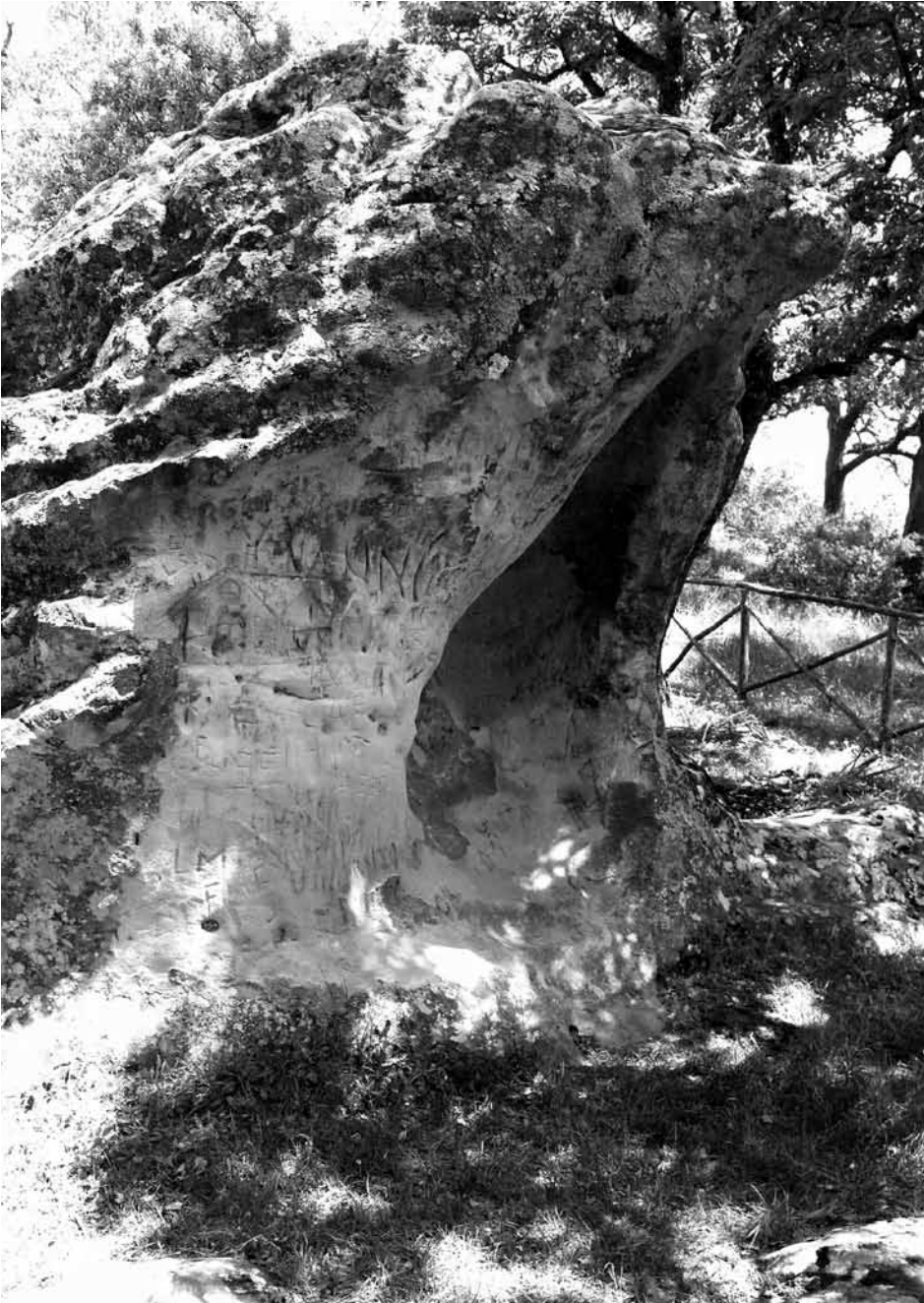
Fig. 8 - La nicchia con i segni alfabetici