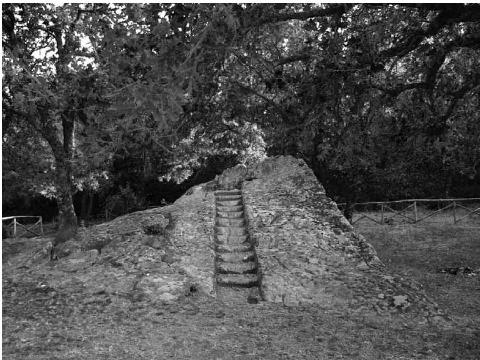
Fig. 4 - Il monolite A

di antropizzazione rituale 23 che indicano il percorso. Raggiunto un piccolo tavolato appare subito il sistema monumentale: due blocchi con evidenti i segni architettonici e la vasca quadrangolare. Ogni porzione del monumento, A-B-C, ha caratteristiche e funzioni proprie: