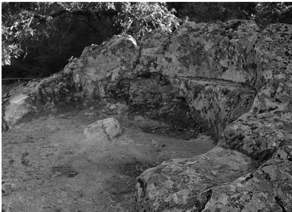
Fig. 5 - La spalliera