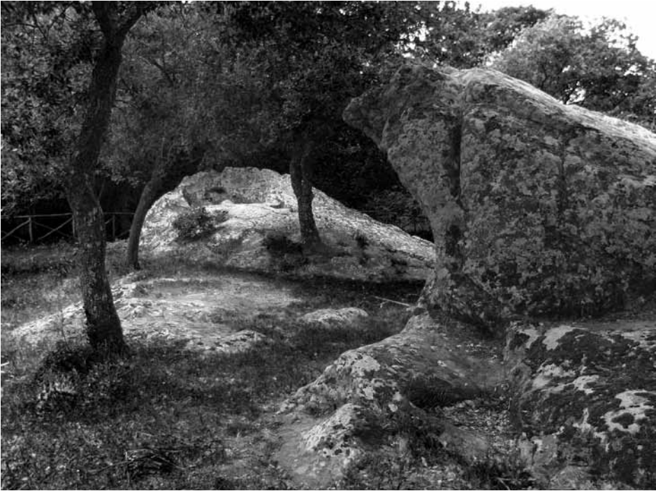
Fig. 3 - Gli elementi litici che compongono il santuario

trova in piano davanti ai due blocchi. Il monumento ha probabile allineamento astronomico, al tramontare del Sole, al solstizio d'inverno e all'alba del solstizio d'estate, (con un Azimut di 59^\circ N-E e un'altezza di 36^\circ all'orizzonte geografico) con punto di osservazione (vedi in ivi monumento B) in asse con il taglio a V sulla spalliera 15 . (Fig. 3).