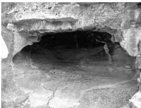
Fig. 2 - Goda Song (Hararghe, Etiopia). Veduta del sito