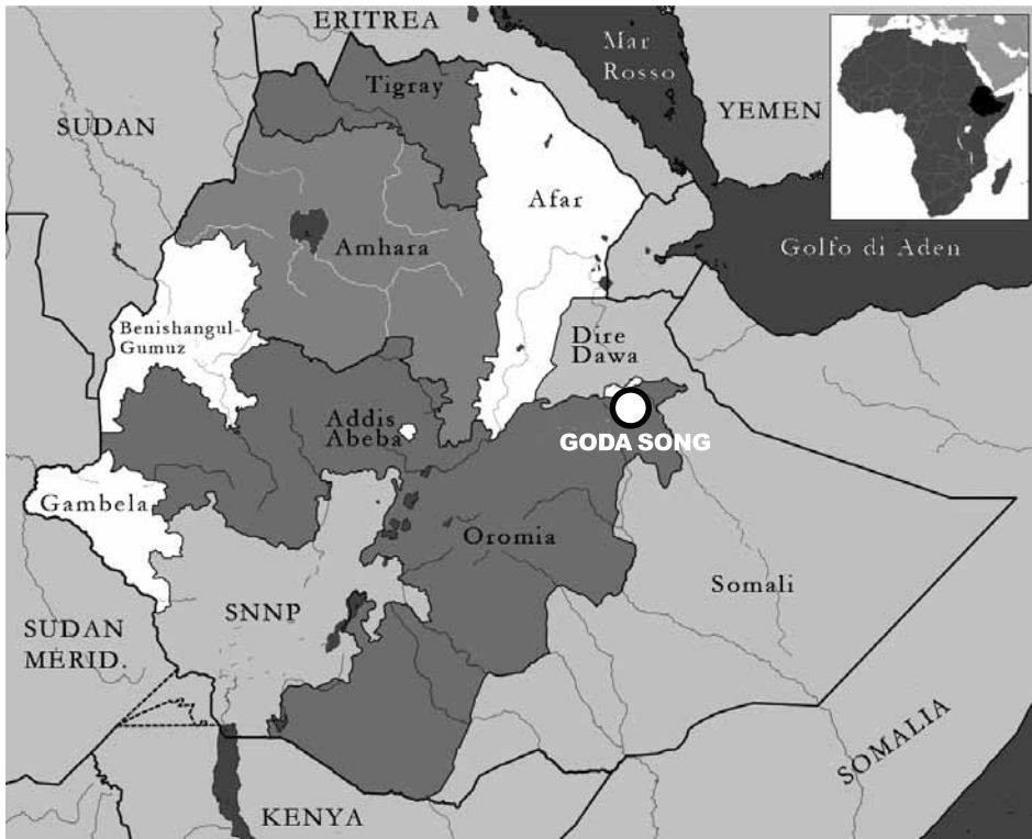
Fig. 1 - Goda Song (Hararghe, Etiopia). Localizzazione del sito