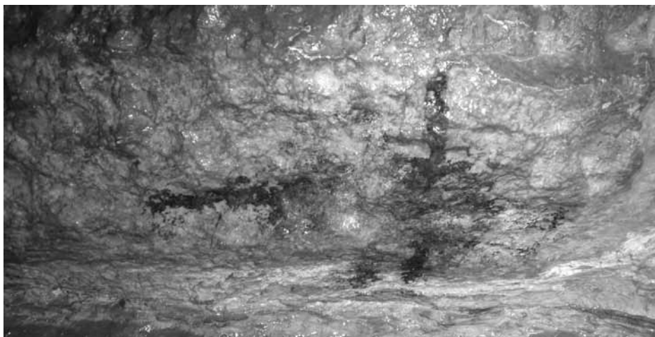
Fig. 5 - Goda Song (Hararghe, Etiopia). Pittura schematica

possono senz'altro essere ricordate, anche se esclusivamente in relazione ad elementi stilistici di carattere generale, quelle con alcune pitture etiopi conservate a Gode Butu (BOUAKAZE-KHAN 2002, pp. 147-149), Saka Sharifa (BOUAKAZE-KHAN 2002, pp. 253-257; VON ROSEN 1949) e Yavello (CLARCK 1945). Tuttavia le maggiori affinità si riscontrano in siti del Somaliland, quali Dheg Weyn Caves (BOUAKAZE-KHAN 2002, p. 337; JÖNSSON 1983, pp. 14-16), God Faraska (BOUAKAZE-KHAN 2002, p. 338; JÖNSSON 1983, p. 26) e le cavità del gruppo di Gan Libah, in particolare Gala Ad e Gerbakele (BOUAKAZE-KHAN 2002, pp. 334, 337; BURKITT, GLOVER 1946, pp. 50-55).