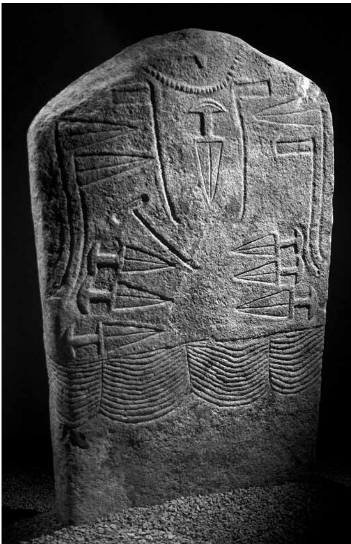
Fig. 1 - Arco 1, MAG - Riva del Garda (Italy)

La comunicazione propone un excursus sullo stato degli studi delle statue stele atesine, cioè rinvenute in Trentino Alto Adige con un focus su alcune nuove metodologie di rilievo 3D.