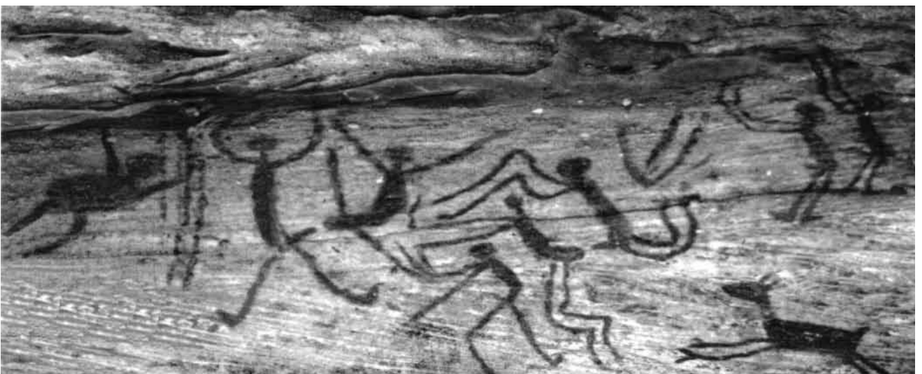
Fig. 5 - Cena do sexo grupal: Toca Baixão do Perna IV