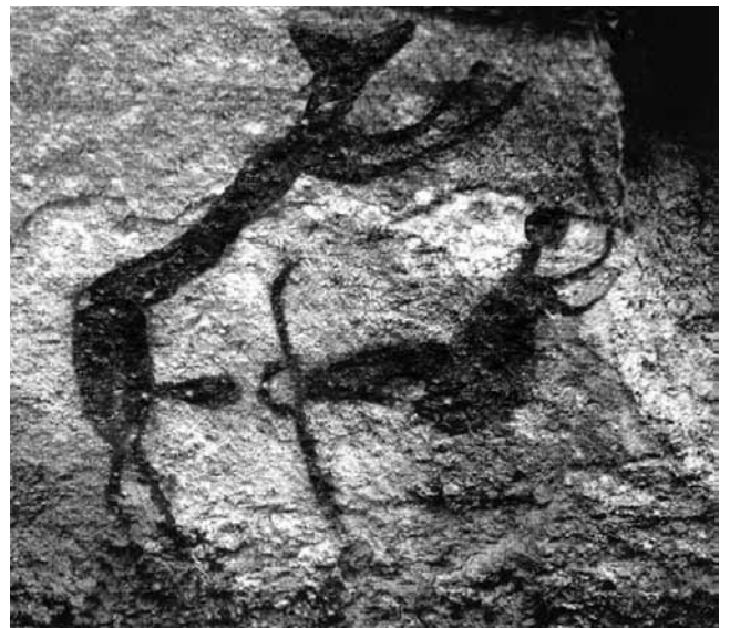
Fig. 4 - Cena de penetração: Toca do Baixão da Vaca