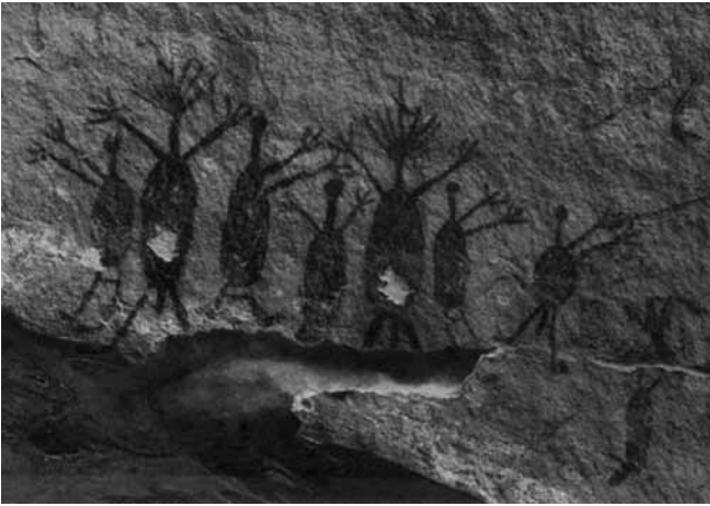
Fig. 1 - Cena do ritual: Toca da Passagem