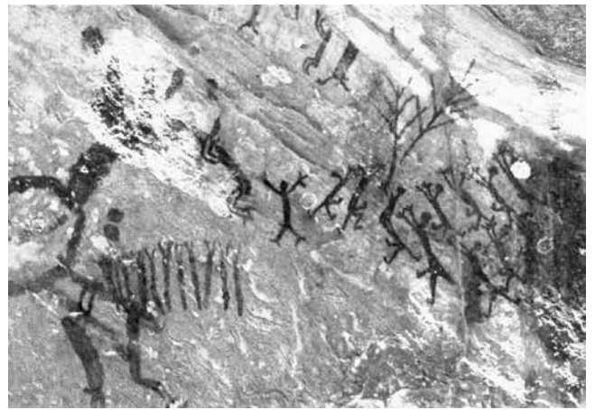
Fig. 2 - Cena da árvore: Toca da Extrema II