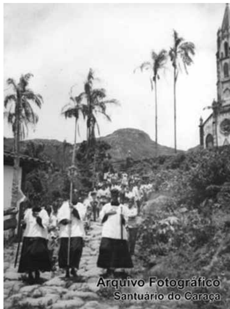
Fig.1 – Peregrinação (Foto do arquivo fotográfico do Santuário do Caraça. Fonte: < http://www.santuariodocaraca.com.br/peregrinacao/ >).

se no Calvário, é constituída por 14 pequenas capelas em “memória da Paixão do Senhor”.