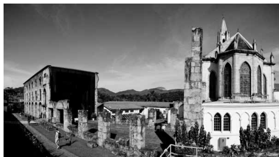
Fig. 4 – À esquerda parte do Museu e dependências do antigo Colégio. À direita, vista dos fundos da Igreja neogótica do Santuário do Caraça.