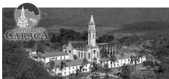
Fig. 3 – Santuário do Caraça.