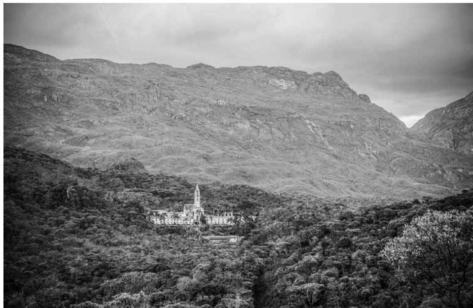
Fig. 2 – Colégio do Caraça conjunto arquitetônico e paisagístico (Foto by Daniel Raposo, licença: CC BY-SA 4.0 < http://creativecommons.org/licenses/by-sa/4.0/ >).