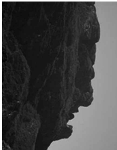
Fig. 6 – O Caraça. Forma do perfil.

Para Mircea Eliade (1992: 17-76) seja qual for o grau de dessacralização do mundo, o Homem que opta por uma vida profana não