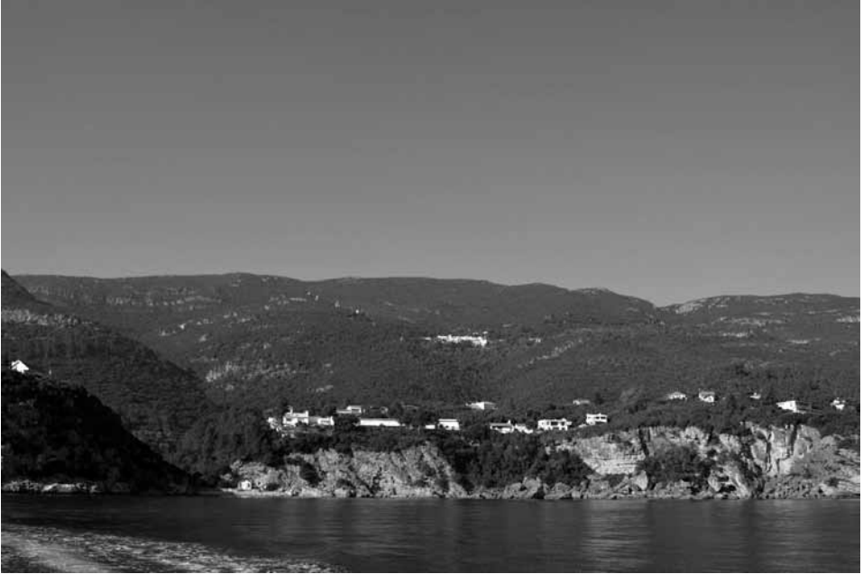
Fig. 1 - Convento da Arrábida e a imensidão da Serra.

utilização funerária pelo Homem de Neanderthal , da Gruta da Figueira Brava, hoje sobre o mar, mas naquele período, de temperaturas mais frias, com uma linha de costa a cerca de 600 metros da atual. Esta gruta no seu interior apresenta formações geológicas em pirâmide, como um altar, e foi na base desta formação geológica que se procederam aos enterramentos.