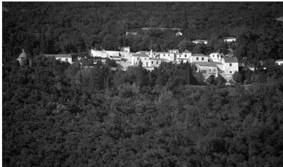
Fig. 5 - Convento da Arrábida.

um ermitão quemorou junto da ermida, sustentado pela casa dos duques de Aveiro, a quem a serra pertencia. Hoje, a capela encontra-se muito vandalizada, mas um novo culto surgiu ligado à comunidade romena de Setúbal, que cuidam da ruína.