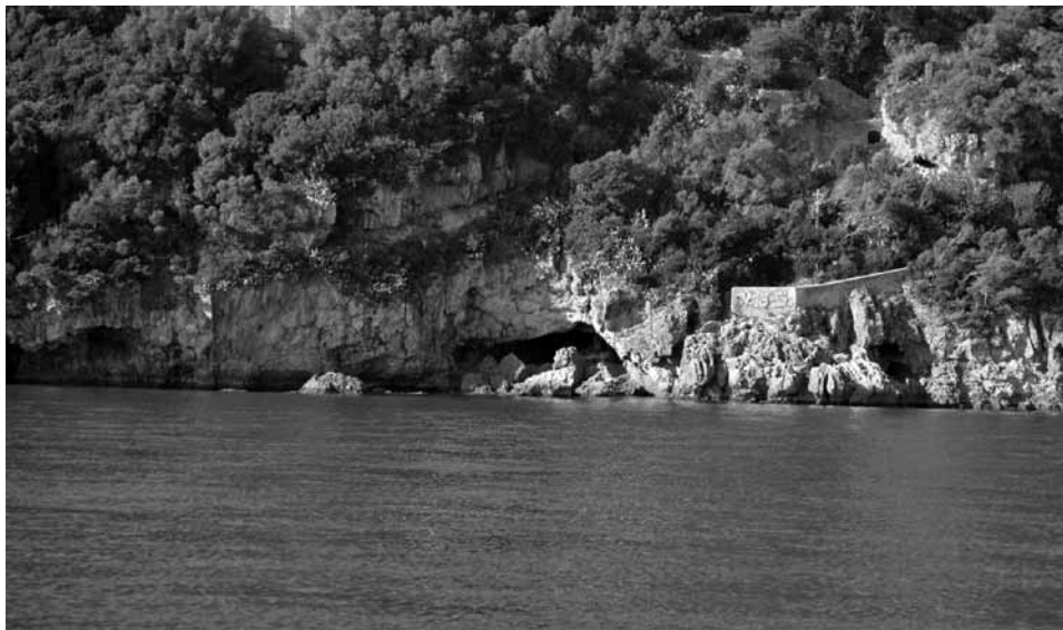
Fig. 4 - Lapa de Santa Margarida.

O domínio do cristianismo na Arrábida, a partir do século XIII, continuou a tradição da Arrábida como espaço sagrado. Hoje a Arrábida alberga grandes espaços Sagrados: o Santuário de Nossa Senhora do Cabo Espichel; o culto ao Senhor Jesus das Chagas; a Ermida de Nossa Senhora delCarmen; a Lapa de Santa Margarida (Fig. 4); a capela de S. Luís da Serra; o culto a Nossa Senhora da Arrábida, no Convento da Arrábida (Gonçalves 1997).