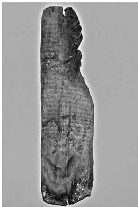
Fig. 2 - Placa escrita em Árabe, século X.

O nível da cultura material foi identificada em 2010, numa gruta, designada de Lapa da Cova, um Santuário de fenícios-púnicos. Há vestígio de práticas rituais, com consumo de vinho, a queima de “incensos” e a deposição de artefactos de adorno, cerca de duas centenas de contas de colar feitas de várias matérias-primas de origem mineral, como a cornalina, o quartzo hialino e a olivina, além de vidro e osso e dois brincos e uma conta esférica em ouro. Foram ainda identificadas cerâmica de torno, correspondendo a ânfora e pithoi , cerâmica manual, atribuíveis ao Bronze Final, que também foram detectados fora da cavidade, quer no caminho a partir do mar, quer no acesso poente a partir da Serra da Achada. No entanto, este sítio ainda está em fase de estudo.